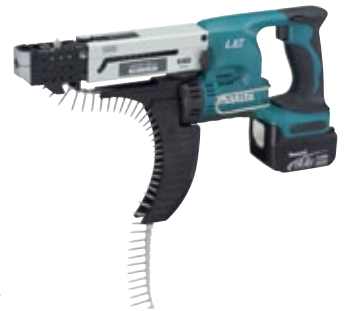
Makita skrueautomat med næse af metal og forbedret skrueføring.

Makita skrueautomaterne findes i seks modeller, 3 forskellige batteri modeller samt 3 forskellige 220 v. modeller. Fås hos grossister med udstyr til håndværkere. Nærmere oplysninger på www.makita.dk